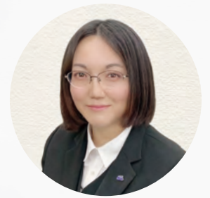
式場スタッフ 大関

この街で皆様のご葬儀のお手伝いを させていただき40年。リニューア ルした式場は、5～15名様 の家族葬にちょうど良い式場です。この機 会にご見学、事前相談や 見積りなど、個人情報 は不要ですので、お気軽に お立ち寄りください。