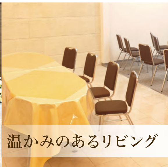
温かみのあるリビング